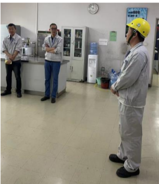
人员点到确认，发现少一员