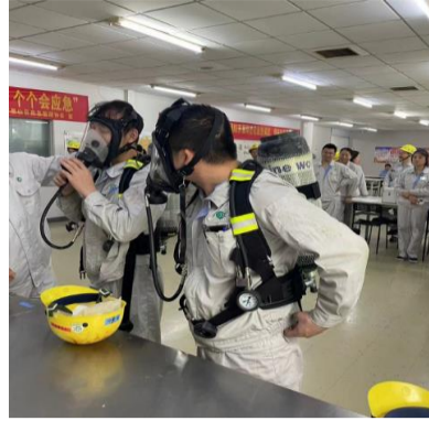
其他人员进行佩戴训练